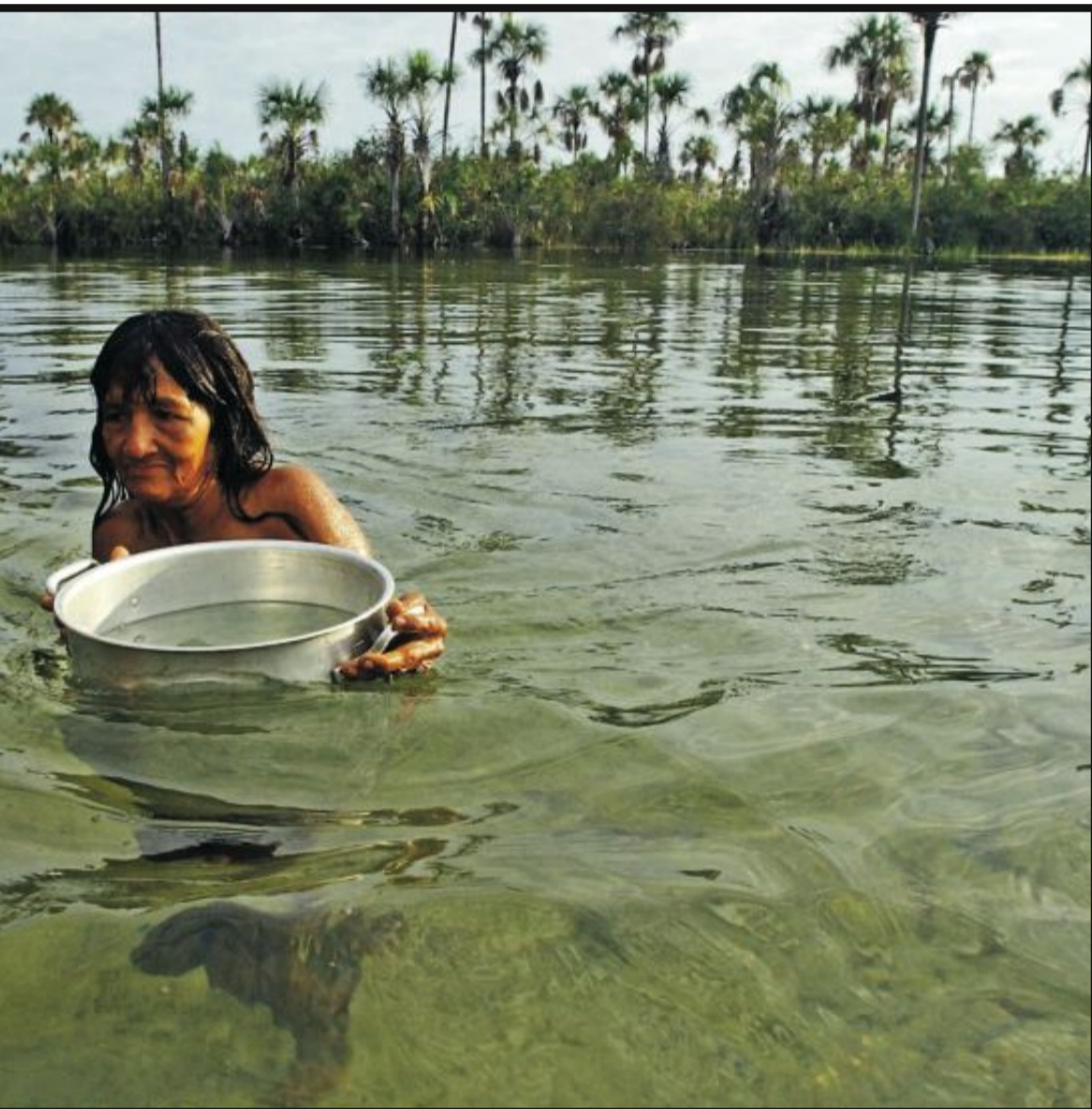
Indianerreservatet i Xingu-provinsen i Brasil lever kvinnene med sin stamme som de har gjort i tusener av år.