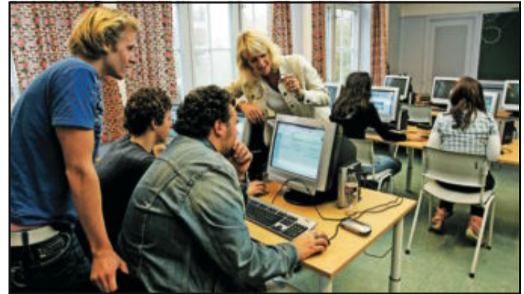
DATA: Overtar mer og mer for bøker i skolen.

Hvis artikkelen ikke hadde brukt eggstokkrekft som eksempel, ville den ha vært utmerket som folkeopplysning. Men eggstokkrekft skal altså som hovedregel opereres med åpen kirurgi.